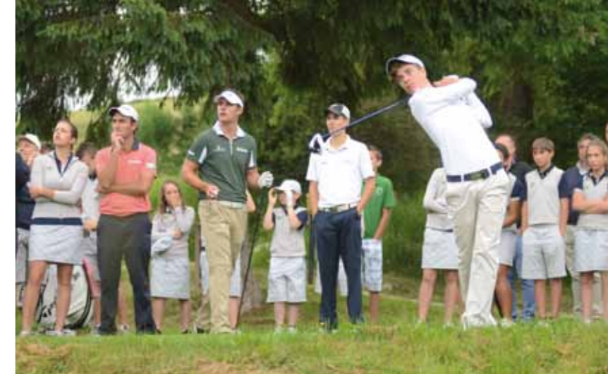
Un momento della gara svoltasi il 23 giugno in occasione dell'inaugurazione

"ABBIAMO TUTTE LE CARTE IN REGOLA PER POSIZIONARCI TRA I MIGLIORI CAMPI EUROPEI DI MONTAGNA E STIAMO LAVORANDO PER FARE DEL NOSTRO CIRCOLO UNA DESTINAZIONE DI RIFERIMENTO PER GOLFISTI ITALIANI E INTERNAZIONALI".